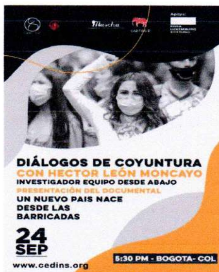
Imagen 1. Convocatoria a presentación de documental resultado de la investigación

En el año 2021 se realizaron investigaciones acerca de la coyuntura política latinoamericana provocada por los levantamientos populares en la región.