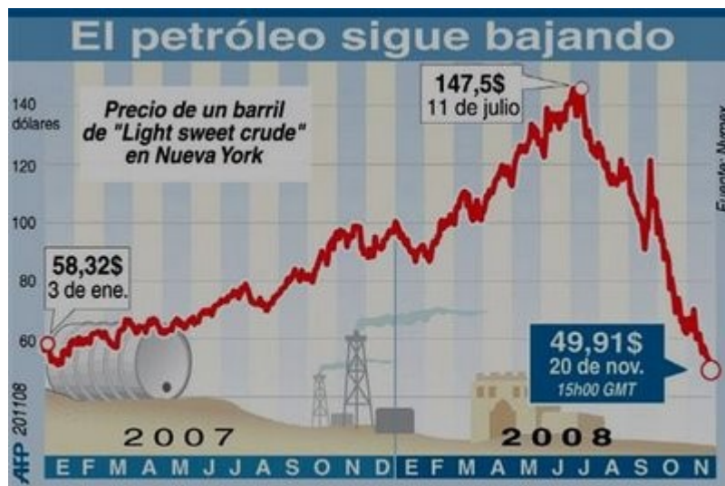
Cuadro 1: EVOLUCIÓN DEL PRECIO DEL PETRÓLEO 2007-08

El ascenso de los precios del petróleo, se da intensamente entre Octubre del 2007 cuando se cotiza en 75$/B hasta Julio del 2008 que se vendió a 147$/B; en 10 meses el petróleo duplico su precio, estimulado según nuestros teóricos por un supuesto incremento de la demanda. El siguiente grafico ilustra este ascenso: